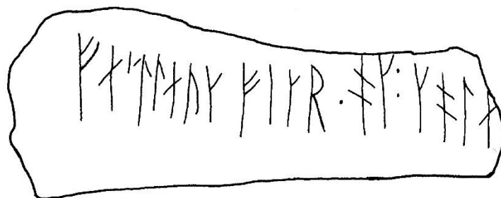
Fig. 1. Inskriften på framsidan (A) av runbenet SI 37 från kv. Ödåker 5. Foto Bengt A. Lundberg 1996 ( Arkivsök ) samt renritning av C. Bonnevier.