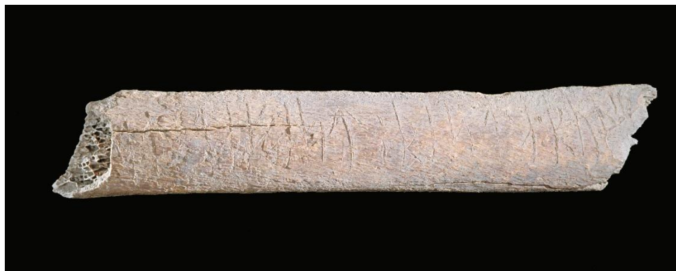
Fig. 1. Runbenet SI 63 från kv. Professorn 1. Foto Bengt A. Lundberg 2000 ( Arkivsök ).

Ett revben med runinskrift påträffades den 28 juli 1999 vid en arkeologisk undersökning i kv. Professorn 1. Fyndet gjordes i ett avsatt kulturlager i utomhusmiljö i dropprummet mellan två hus på Tomt II (Ruta G14. Kontextnummer 627. Fyndnummer 50406). Fyndet tillhör Fas 16a (Wikström et al. 2021, s. 350), som har daterats till perioden ca 1240–1255. 1 Benet är 146 mm långt, 25 mm brett och 7 mm tjockt. Runornas höjd 12 mm. Dess vänstra kortsida är diagonalt och snett avskuret, den högra snett avbrutet. Benet förvaras i Sigtuna museum ( inv. nr 106202 ).