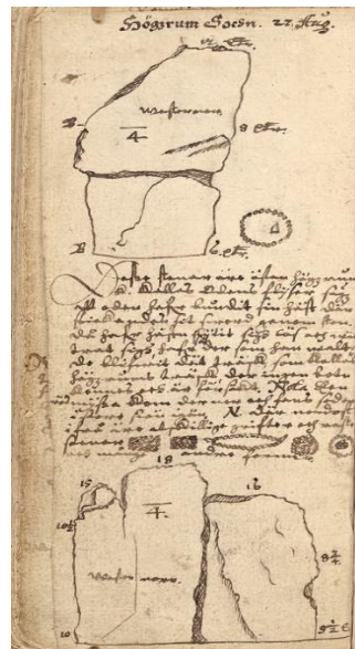
Figur. 3-4. Johannes Bureus dokumentation av en runhäll från tidigt 1600-tal (vänster), Johannes H. Rhezelius dokumentation av fornlämningar på Öland från 1634 (höger).