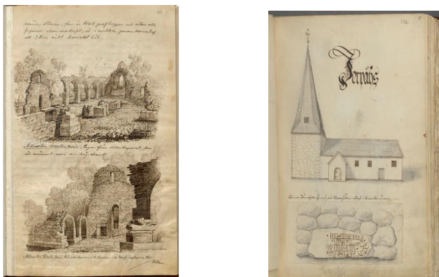
Figur. 5-6. Pehr Arvid Säves dokumentation av Alvastra klosterkyrka, Östergötland, från 1870-talet (vänster) Dokumentation från sekelskiftet 1700 av Järpås medeltida kyrka i Västergötland (höger).

I samband med att en ny fornminnesförordning trädde i kraft 1828 befastes akademiens och riksantikvariens ansvar för kulturminnesvården. En pådrivande kraft under denna period var det patriotiska och inflytelserika Götiska förbundet och i takt med att dess medlemmar valdes in i Vitterhetsakademien hamnade frågor om kulturminnesvård och arkeologi allt högre upp på dess dagordning. Som ett led i detta grundades under ledning av Bror Emil Hildebrand Historiska museet i Stockholm runt mitten av seklet. 1867 utökades myndighetens ansvarsområden med att en ny fornminnesförordning instiftades samtidigt som Historiska museet befäste sin roll som en förvaltande och forskande institution. På så vis började man nu skilja mellan myndighetens inre respektive yttre verksamheter, dvs. mellan samlingsförvaltning och kulturminnesvård. Därmed hade målet med att utveckla en stark och professionell centralorganisation för kulturminnesvård och forskning uppnåtts.