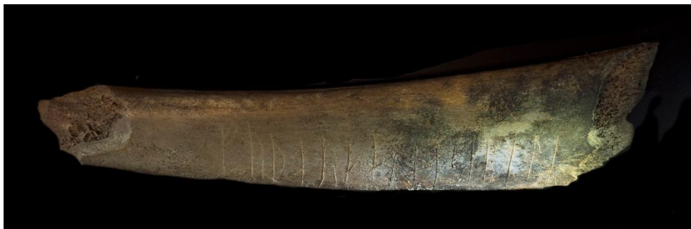
Fig. 1. SI 109 Sigtuna, Kv. Professorn 4. Sida A med futharkinskriften.

Ett revben av nöt med en runinskrift och en triangelfigur på den ena sidan och en skeppsbild på den andra påträffades år 1995 vid en arkeologisk undersökning i kv. Professorn 4 (Provruta 5:3. Fyndnummer 5557). Revbenet har preliminärt daterats till 1100-talet. Det förvaras nu i Sigtuna museum ( inv. nr 54280 ). Det har en längd av 168 mm, bredd av 35 mm och tjocklek av 11 mm. Runhöjd 17 mm (8 n).