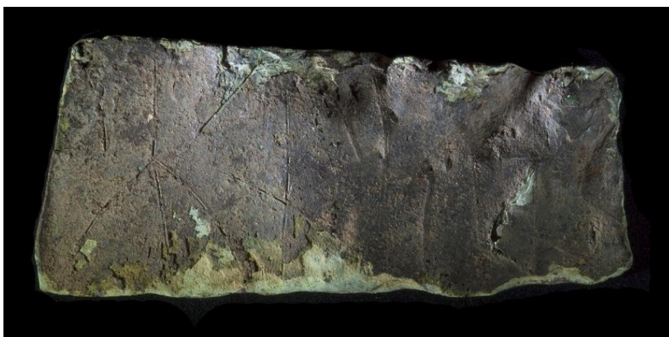
Fig. 2. Sida B av runblecket från kv. Granhäcken. Foto Edvard Koinberg, Sigtuna museum, samt renritning av Magnus Källström 2016.

Till läsningen: 1 Blecket är kraftigt ärgat, vilket gör inskriften delvis svår att reda. Huvudstaven i den första bevarade runan sammanfaller med brottkanten, men ett litet stycke finns bevarat upptill. Från mitten går en bågböjd bistav som kan följas ned till den nedre kanten. Runan är av allt att döma r , men skulle möjligen också kunna tolkas som en u -runa med lågt ansatt bistav. Runa 2 är h med bistavarna ansatta högt upp på huvudstaven. Bistaven snett nedåt vänster har en flackare vinkel än den som går snett nedåt höger. Dessutom är den utdragen så långt åt höger att den korsar toppen på den följande runan. Runa 3 har på den vänstra sidan en ensidig bistav snett nedåt vänster, som kan följas ned till kanten. Ett stycke av denna är täckt av korrosion. Sannolikt rör det sig om en a -runa. Den övre delen av bistaven i 4 r är bågböjd och ansluter till mitten av huvudstaven. Den nedre delen av bistaven är delvis täckt av korrosion. Runa 5 har på mitten en dubbelsidig bistav snett nedåt höger och tolkas enklast som en n -runa. 6 s har vågrätt mellanled. Runa 7 utgörs av en t -runa med två bistavar, där mitten av huvudstaven korsas av en dubbelsidig bistav snett nedåt höger. Runan kan tolkas som en bindruna mellan t och n , men det skulle också kunna röra sig om en variant av den stungna d -runan. Runa 8 består av en rak huvudstav med två dubbelsidiga bistavar snett nedåt höger. Bistavarna är ansatta långt ifrån varandra och förskjutna åt höger.