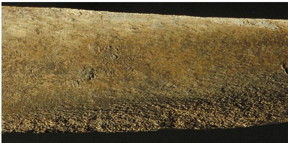
Fig. 2. Förstoring av inskriften på SI 68 från Professorn 4. Foto Bengt A. Lundberg 1996 ( Arkivsök ).

De två oidentifierade tecknen är egentligen inte särskilt runlika. Det första utgörs av en båge med ett kryss under och det andra av ett v-format tecken. I det senare fallet skulle man kunna fundera på om det är den latinska versalen V som har avsetts. Hela inskriften ska kanske snarast uppfattas som en skriftimitation.