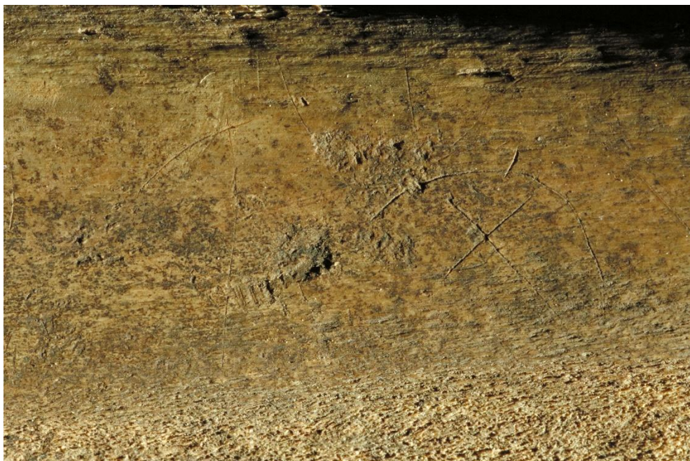
Fig. 3. Detalj av inskriften med de två inledande tecknen. Foto Bengt A. Lundberg 1996 ( Arkivsök ).

De två oidentifierade tecknen är egentligen inte särskilt runlika. Det första utgörs av en båge med ett kryss under och det andra av ett v-format tecken. I det senare fallet skulle man kunna fundera på om det är den latinska versalen V som har avsetts. Hela inskriften ska kanske snarast uppfattas som en skriftimitation.