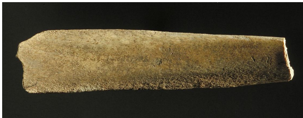
Fig. 1. Revbenet SI 68 från Professorn 4 med runor eller runliknande tecken.

Ett revben med runor och runliknande tecken påträffades vid en arkeologisk undersökning i kv. Professorn 4 år 1996 (E4:3. Fyndnummer 5287). Revbenet har preliminärt daterats till 1100-talet. Benets längd är 142 mm, bredd 34 mm, tjocklek 8 mm. Ristningen finns på den konkava sidan. Benet förvaras nu i Sigtuna museum ( inv. nr 54010 ).