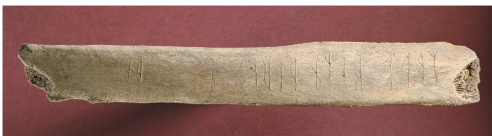
Fig. 2. Runbenet Sl 71 från kv. Professorn 1 i Sigtuna. Runorna på sida B.

mellan runorna i futharken. Bistaven i 5 u svänger nertill in mot huvudstaven. 7 o har dubbelsidiga bistavar snett nedåt höger/snett uppåt vänster, så också 21 o . Bistaven i 8 r når inte ner i jämnhöjd med huvudstavens bas. 10 h har dubbelsidiga bistavar. 11 n har dubbelsidig bistav snett uppåt höger/snett nedåt vänster. Ristaren har glömt att rista en s -runa efter 14 a och efterhand skurit ett litet långkvist- s , men placerat det felaktigt efter 12 i . 15 t har liksom 24 t dubbelsidig bistav. Mellan 19 m och 20 r är ett mellanrum på 13 mm, jämfört med 7 mm mellan runorna i futharkinskriften. Bistaven i 22 p är högt placerad och runan ser ut som en spegelvänd storbokstav P.