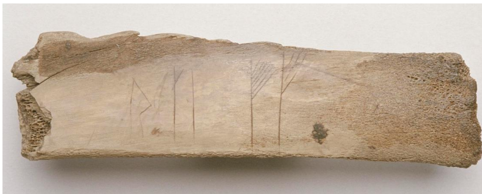
Fig. 2. Baksidan av runbenet SI 89 från kv. Professorn 1. Foto Bengt A. Lundberg 2000 ( Arkivsök ).