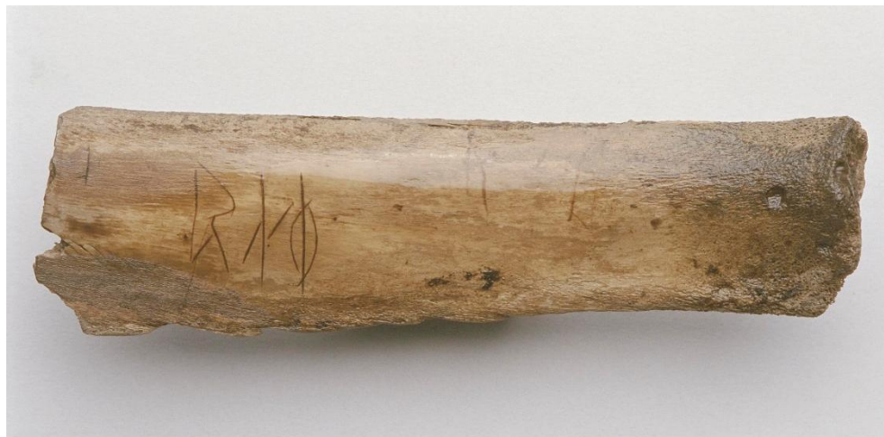
Fig. 1. Framsidan av runbenet SI 89 från kv. Professorn 1.

Revben med runor på vardera sidan av benet. Benets längd är 125 mm, bredd 35 mm och tjocklek 13 mm. Runhöjd 15 mm–28 mm (1 r resp. runa 9).