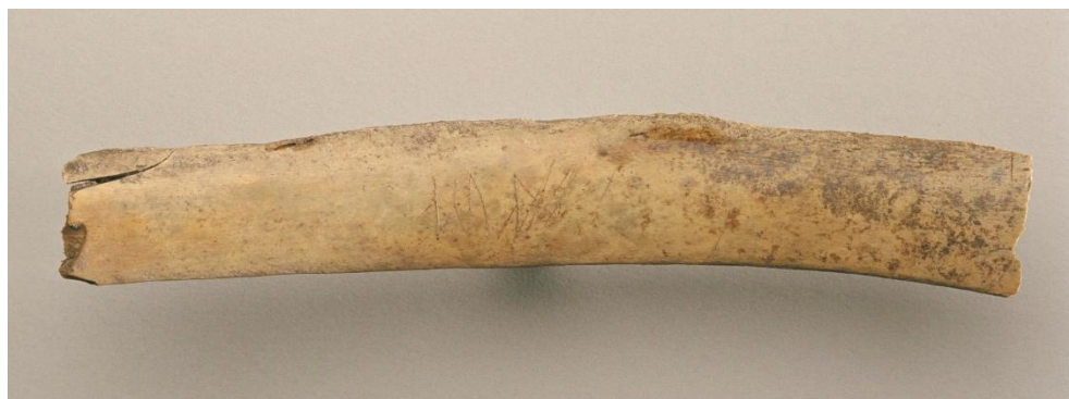
Fig.1. Runbenet SI 95 från Professorn 1.

Benets längd är 162 mm, bredd 26 mm och tjocklek 6 mm. Runorna är 11 mm höga. Ristningen finns på den konkava sidan av benet.